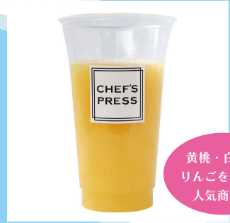
【B3】<シェフズプレス> もも&りんごジュース 501円