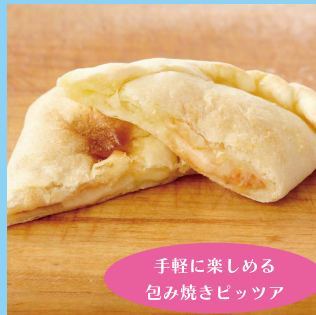
【B3】<アントニオ> カルツオーネ (各種) 486円