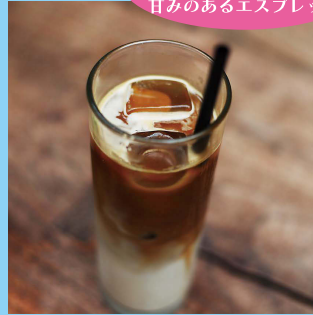
【B2】<ポールバセット> カフェラテ(アイス) R:530円 L:630円 ※テイクアウトはカップでのご提供となります。