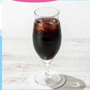
【B3】<キャピタルコーヒー> アイスコーヒー 545円 ※テイクアウトはカップでのご提供となります。