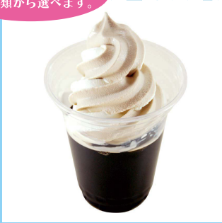
【B3】<キャピタルコーヒー> コーヒーゼリーソフトクリームのせ (各種) 701円～