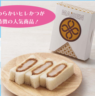
【B3】<とんかつまい泉> ヒレかつサンド (3切) 454円