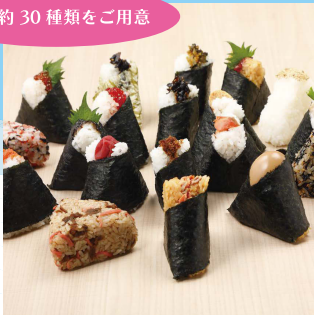
【B3】<新潟ゆのたに心亭> おにぎり各種 240円～