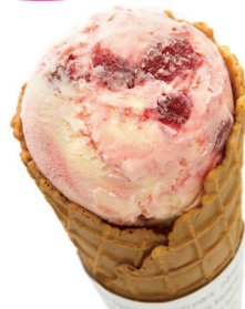
【B2】<パティスリー・サタハレ・アオキ・パリ> グラスアラフレーズ 594円