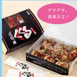
【B3】<たこ家道頓堀くくる> 大たこ入りたこ焼 8個入 778円