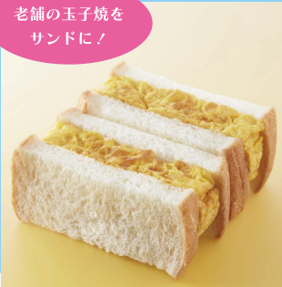
【B3】<つきち松露> 松露サンド 756円