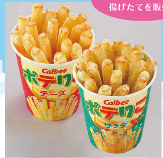
【B2】<カルビープラス> ポテリこチーズ、ポテリこサラダ 各401円 ■販売期間：5/2(木)～8(水) ■B2 イベントスペース (フルーリア前)