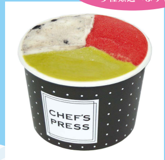
【B3】<シェフズプレス> ジェラート (3種) 601円