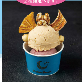
【B2】<ファーイーストバザール> ジェラート(カップ) 648円～